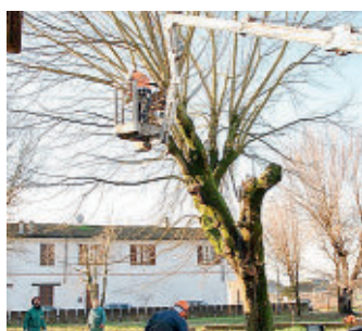
I giardinieri all'opera

ne il patrimonio arboreo e il verde da piazza Matteotti a piazza Europa, fino all'area antistante il cimitero, al viale del cimitero, al centro sportivo, ai parchetti di via Foscolo e via XX Settembre. Si guarda alla sicurezza e al decoro, dopo una serie di sopralluoghi effettuati da agronomi e da aziende specializzate che hanno rilevato le criticità, così l'Amministrazione comunale ha deciso di intervenire su tutto il