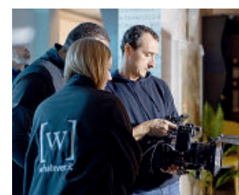
La troupe al lavoro

● L'agenzia pubblicitaria milanese Whatever gira a Castiglione. Si tratta di uno spot che andrà in onda su Raiuno durante il Festival di Sanremo. La troupe lavora all'interno dello showroom del mobilificio Cighetti. La location è stata selezionata per ambientare il lancio di "Suprema", nuovo brand della Eurovast di Lucca, specializzata in prodotti