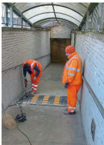
Lavori al sottopasso

sicurezza. Il sottopasso serve ogni giorno a tantissimi cittadini per arrivare in bicicletta o a piedi al di là della ferrovia. Le varie Amministrazioni comunali sono sempre state incalzate dai residenti del popoloso quartiere. Al Villaggio San Biagio c'è anche il liceo Novello con un importante passaggio degli stu-